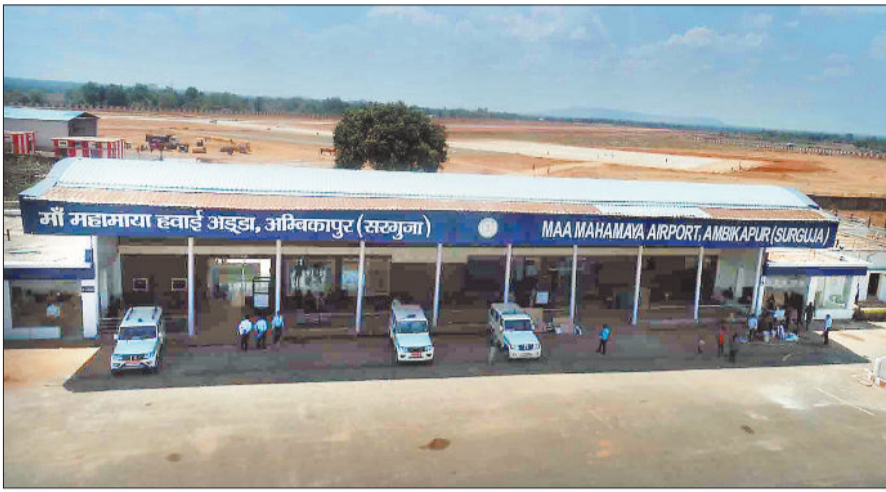
मां महामाया हवाई अड्डा, अम्बिकापुर (सरगुजा)

प्रबंधन एवं सेवा प्रदाता एयरलाइंस एलाइंस एयर के अधिकारी-कर्मचारी तैयारियों का अंतिम रूप देने में जुटे हैं। आवागमन सुविधाओं की दृष्टि से बेहद पिछड़े सरगुजा में लम्बे समय से महानगरों तक हवाई जहाज चलाने की मांग हो रही थी। शासन द्वारा इस दिशा में पहल करते हुए क्षेत्रीय उड़ान सेवा के तहत अम्बिकापुर से बिलासपुर एवं रायपुर के लिए 18 सीटर हवाई सेवा की सौगात दी गई तथा हवाई सेवा संचालन की जिम्मेदारी फ्लाइट