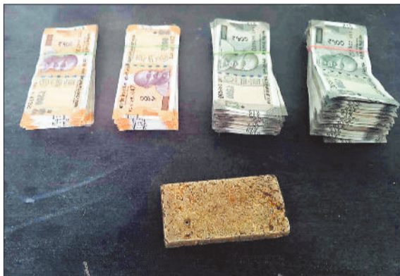
जबन रूपए व नकली सोना।