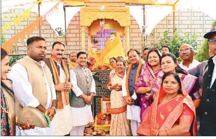
कार्यक्रम में उपस्थित मुख्यमंत्री व अन्य जनप्रतिनिधि।

कार्यक्रम में शामिल होने पहुंचे सीएम श्री साय ने कहा कि साहू समाज एक अत्यंत गौरवशाली समाज है। भक्त माता कर्मा, माता राजिम दाई व दानवीर भामाशाह जैसी महान विभूतियां इसी समाज की देन हैं। सीएम श्री साय ने कहा कि छत्तीसगढ़ के विकास में सबसे बड़ी बाधा नक्सलवाद था। केरल से भी बड़े भू-भाग वाला बस्तर क्षेत्र 40 वर्षों से अधिक समय तक नक्सल हिंसा से ग्रस्त रहा, जहां न सड़क थी, न बिजली, न पानी।